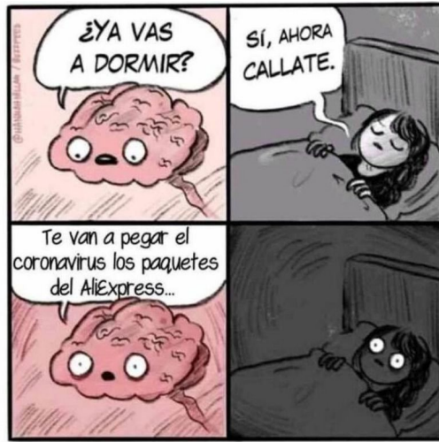
FIGURA 14. COVID-19 Y VIDA COTIDIANA

Las subjetividades están marcadas en la actualidad por el temor a lo que antes era habitual: «ya ni soñar se puede... cada vez peor...» (Mujer). La ironía ante la resignación se hace presente como un signo de estos tiempos: «No sueñe amigüe... quédese en el rebaño del corona no ma...» (Hombre).