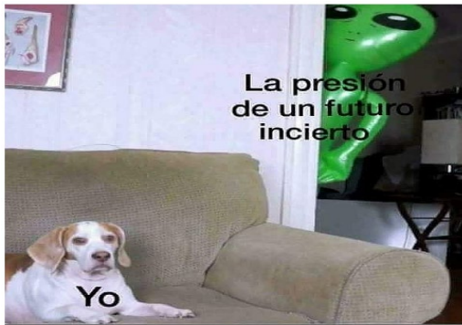
FIGURA 8. MEME SOBRE PRESIÓN POR FUTURO INCIERTO. INSTAGRAM

Los contactos virtuales subscriben con congoja la idea de intimidación por el futuro incierto: «Tan triste pero cierto» (Mujer). No obstante, también ofrecen alivio relativizando la noción de porvenir: «el futuro no existe» (Mujer), o significando con levedad la certeza de vivirlo: «Nah. Me da suda el futuro. Quizás estemos muertos mañana» (Hombre).