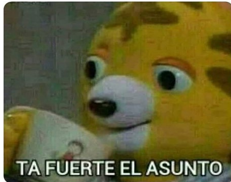
FIGURA 4. MEME SOBRE INCERTIDUMBRE EN EL ACTUAL CONTEXTO. INSTAGRAM