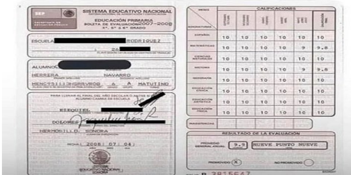
FIGURA 6. MEME SOBRE EXITISMO. INSTAGRAM

Todos los que tuvieron calificaciones así ahora sufren de ansiedad, depresión y les cuesta mantener una relación estable.