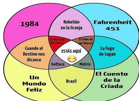
FIGURA 5. MEME SOBRE AGOBIO SOCIAL. INSTAGRAM

su cotidianidad. Ello es representado a través de títulos de películas o de novelas que han sido convertidas en filmes, que permiten transmitir tales subjetividades: