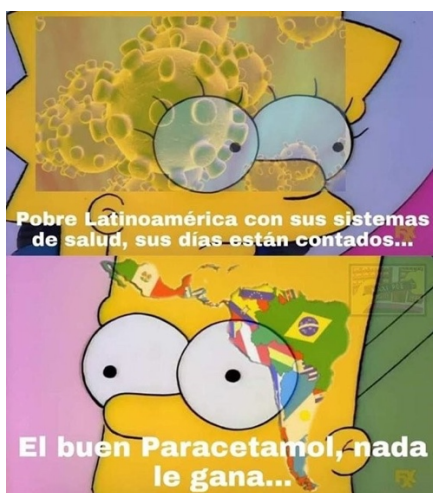
FIGURA 12. COVID-19 EN AMÉRICA LATINA. INSTAGRAM

La presencia del Covid-19 en nuestras sociedades deja de manifiesto el agobio existencial con que las juventudes viven la pandemia, en un territorio que no les ofrece seguridades ni soluciones profundas: