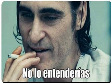
FIGURA 10. COVID-19 Y FUTURO. INSTAGRAM

— Abuelo, ¿por qué te lavas las manos tan seguido?