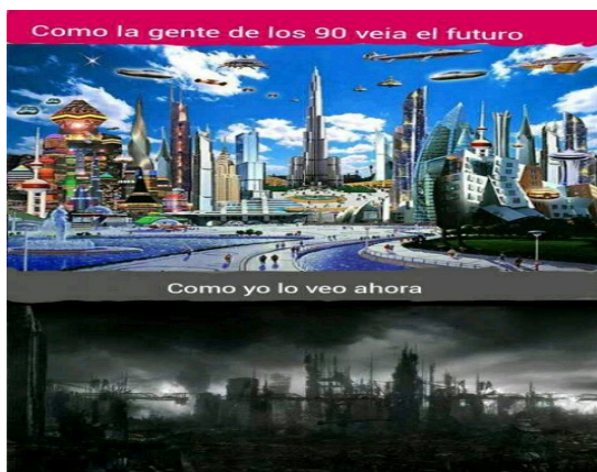
FIGURA 9. MEME SOBRE FUTURO NEGATIVO. MEMEDIOD

Entretanto, la idea apocalíptica sobre el futuro en que la noción de progreso está desacoplada de la felicidad humana es transmitida a través de una imagen, en que se contrastan los años 90 tipificados como el sueño de un futuro dinámico, de progreso y felicidad, con la representación actual de un futuro oscuro: