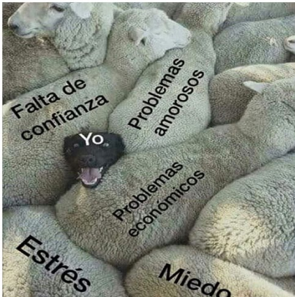
FIGURA 1. MEME SOBRE AGOBIO COTIDIANO. INSTAGRAM

La subjetividad que es transmitida por esta imagen es secundada a través de la figura del auxilio frente a la asfixia de la cotidianidad: «pondré esta foto en el comedor junto con mi inhalador» (Mujer). Entretanto que se sugieren formas de evasión, a través del consumo de drogas: «Pues a comerse un tripi o unas setas, y ver cómo desaparece todo. O mejor dicho, ver cómo aprendes a mandarlo a la mierda xD» (Sexo sin determinar).