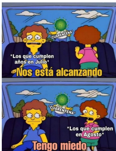
FIGURA 13. COVID-19 Y VIDA COTIDIANA. INSTAGRAM

La cotidianeidad de los hitos que marcan los cursos de vida juveniles, también son afectados por la pandemia y se viven como pérdida de libertades y angustia: