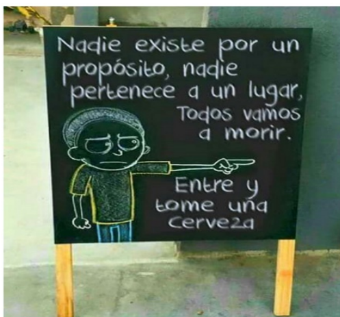
FIGURA 3. MEME SOBRE DESARRAIGO E INCERTEZA. INSTAGRAM

Mientras, el vacío existencial y la ambivalencia generada por la pérdida de univocidad en las sociedades actuales son vividos como desarraigo e incerteza en el futuro: