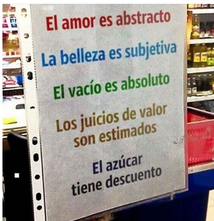
FIGURA 2. MEME SOBRE VACÍO EXISTENCIAL. INSTAGRAM.

Conjuntamente, la sensación de vacío que se entreteje con la cotidianidad como parte de la inseguridad existencial es compartida a través de una imagen que a su vez entremezcla lo abstracto con lo concreto del diario vivir: